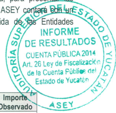
Cuantificación monetaria de las observaciones (miles de pesos)